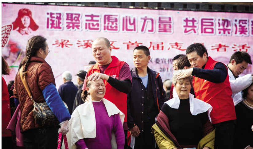
3月5日,梁溪区首届志愿者活动月在南禅寺广场拉开帷幕