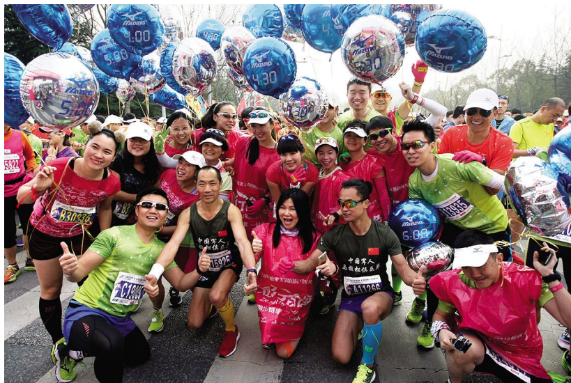
35名资深跑友参加2016无锡国际马拉松赛并充当领跑员,气球上的时间表示跑完全马的用时

27日 印度驻沪总领事古光明率代表团到无锡,参加“印度—中国(无锡)商务与投资论坛”和“印度文化周”活动。市长汪泉会见代表团一