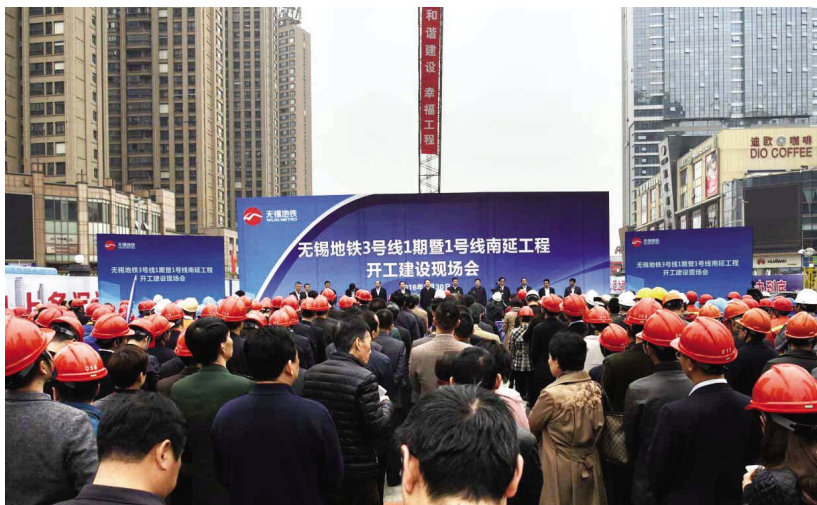
3月30日,无锡地铁3号线一期、1号线南延线工程开工建设

1日 普洛斯集团与无锡高新技术产业开发区签署战略合作协议,在无锡投资8亿美元,设立普洛斯环普产业园。省委常委、市委书记