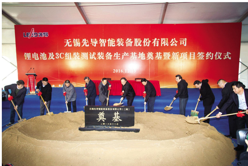
无锡先导智能锂电池及3C组装测试装备生产基地项目奠基仪式

△江苏隆达集团召开创新发展暨高温合金技术研究院和院士工作站成立大会。中国工程院院士干勇、才鸿年、谢建新和中国科学院院士朱静等,以隆达集团特聘院士的身