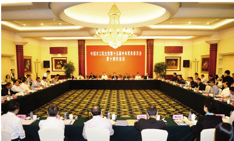
6月2日,中国农工民主党第十五届中央常务委员会第十四次会议在无锡召开

13日 省委书记罗志军到无锡就推进科技创新进行调研,主持召开苏南国家自主创新示范区建设工作座谈会。