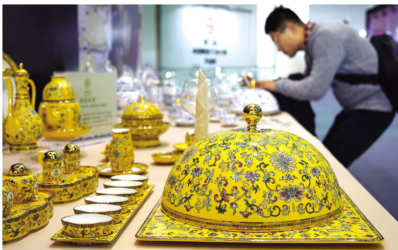
13届中国(无锡)国际设计博览会上,观众欣赏一家江苏企业专为APEC会议和世界互联网大会定制的精美餐具

【会展业稳步发展】 2016年,无锡市会展产业持续增长。全市共举办各类会展活动115个,展览总面积逾90万平方米。市会展办在会展管理、协调服务、宣传推广、招商招展等方面开展工作,重新制定出台《无锡市服务业(节会)资金管理实施细则》,新增对举办国内会议支持政策,符合条件的会议和展览项目最多可获得80万元的政策支持。以产业强市为重心,引导新兴产业会展项目和会展产业做大做强,物联网、新能源、高端机械装备等新兴产业展会活动的规模和影响力显著提升。10月底,成功举办世界物联网博览会。加强会展人才培养,举办“展会安保工作”“从评估看会展品牌提