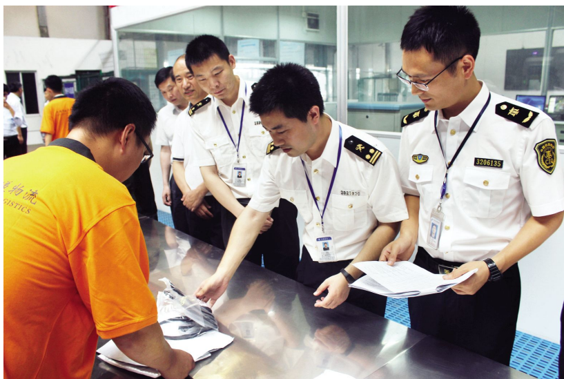
6月29日,无锡海关、无锡出入境检验检疫局验放首批跨境电商出口货物,标志着无锡市跨境电子商务业务正式落地开局

【优化通关环境】2016年,无锡海关推进区域通关一体化改革,全年一体化报关单占比35.7%,超出关区平均水平约4倍。无纸化与税收电子支付比例长期超过99%,进出口24小时通关率位居关区前列。持续提升物流通关效率,依托综合保税区“智能卡口”功能,开展“掌上物流”模式改革,企业刷手机二维码过卡口,日均通车1000辆次,物流效率明显提高。推进航空一类口岸功能做大做强,支持开辟新加坡、韩国釜山等新航线,加密已有航班,配合机场二期改造,优化旅检现场通关监