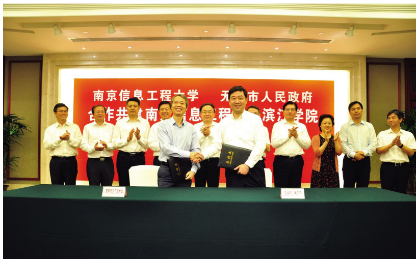
市政府与南京信息工程大学签约合作共建滨江学院

【教育教学创新与实践】 2016年,江南大学在52个专业招收本科生5053人,毕业4745人,年内有全日制在校本科生20056人;招收研究