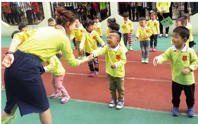
诚明实验幼儿园晨间锻炼活动

【中青年干部培训班】 7月4日，市教育局2016年度中青年干部培训班在无锡市委党校开班，来自市直属院校的38名中青年干部参加培训。此次中青年干部培训主要分为理论学习、党性锻炼、能力提升3个模块，内容包括党章党规、习近平总书记系列重要讲话、无锡经济形势、个人品行修养、现代管理能力等多个方面的专题学习，通过现场教学、跟岗学习、小组研讨、学员论坛等形式，使参训学员进一步强化政治意