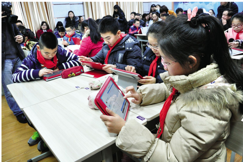
“翻转课堂”教学观摩研讨会现场

【第十届中国卓越创新校长论坛】 4月23~24日,第十届中国卓越创新校长论坛暨基础教育国家级教学成果奖推广大会在江苏省天一中学举行。论坛以“促进教师专业成长、