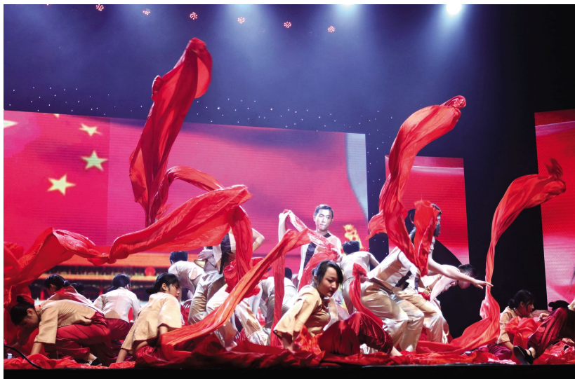
2016年无锡市校园艺术节迎新汇报展演