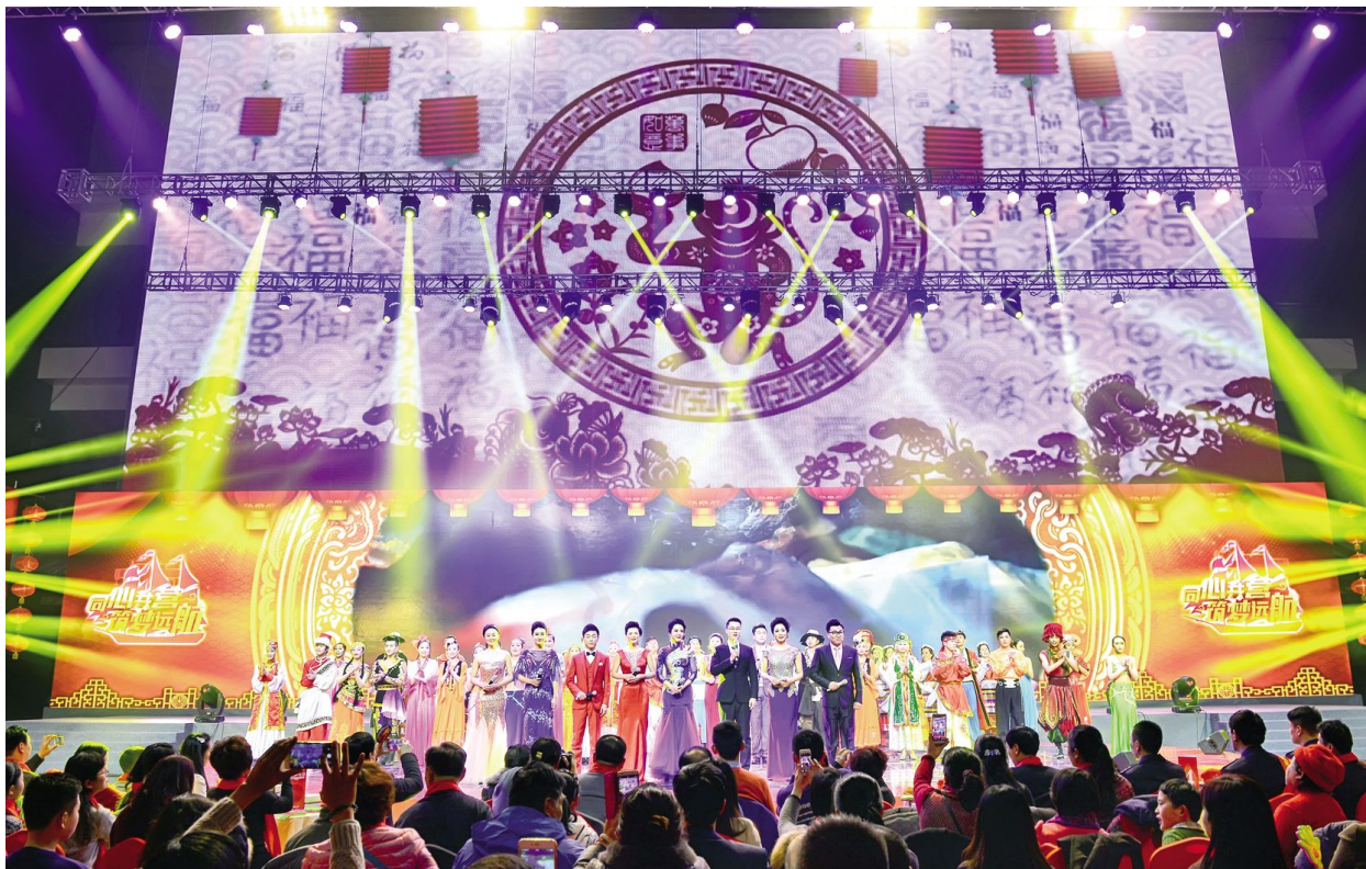
2016年无锡广电“和你在一起”迎春特别节目现场