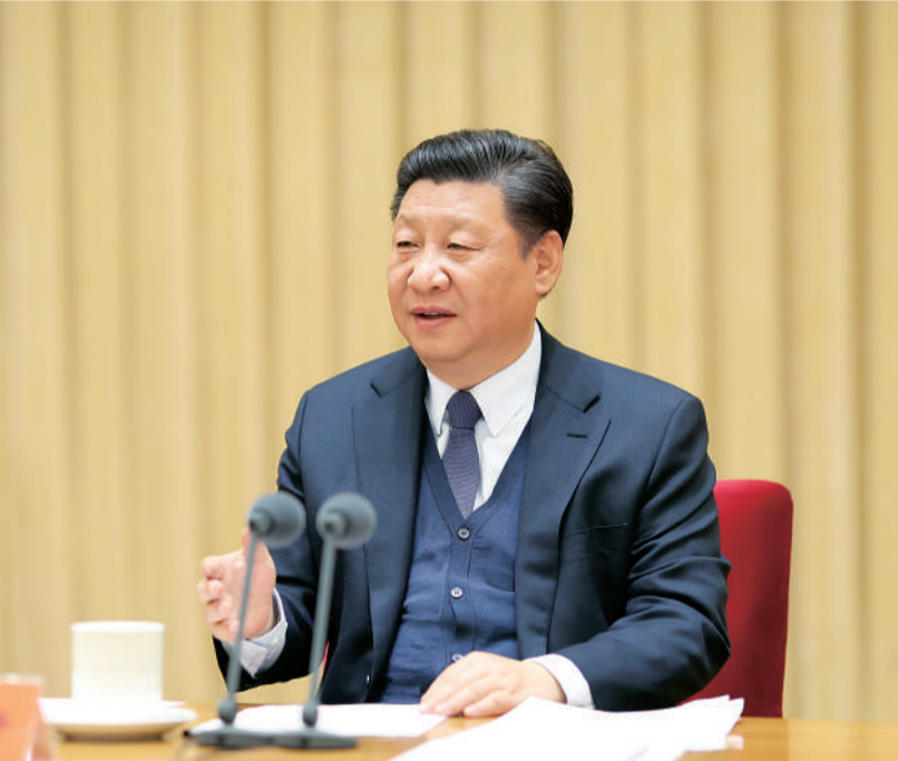
1月15日至16日,中央政法工作会议在北京召开。中共中央总书记、国家主席、中央军委主席习近平出席会议并发表重要讲话。

新华社北京1月16日电 中央政法工作会议15日至16日在北京召开。中共中央总书记、国家主席、中央军委主席习近平出席会议并发表重要讲话。他强调,要坚持以习近平新时代中国特色社会主义思想为指导,坚持党对政法工作的绝对领导,坚持以人民为中心的发展思想,加快推进社会治理现代化,加快推进政法领域全面深化改革,加快推进政法队伍革命化、正规化、专业化、职业化建设,忠诚履职尽责,勇于担当作为,锐意改革创新,履行好维护国家政治安全、确保社会大局稳定、促进社会公平正义、保障人民安居乐业的职责任务,不断谱写政法事业发展新篇章。