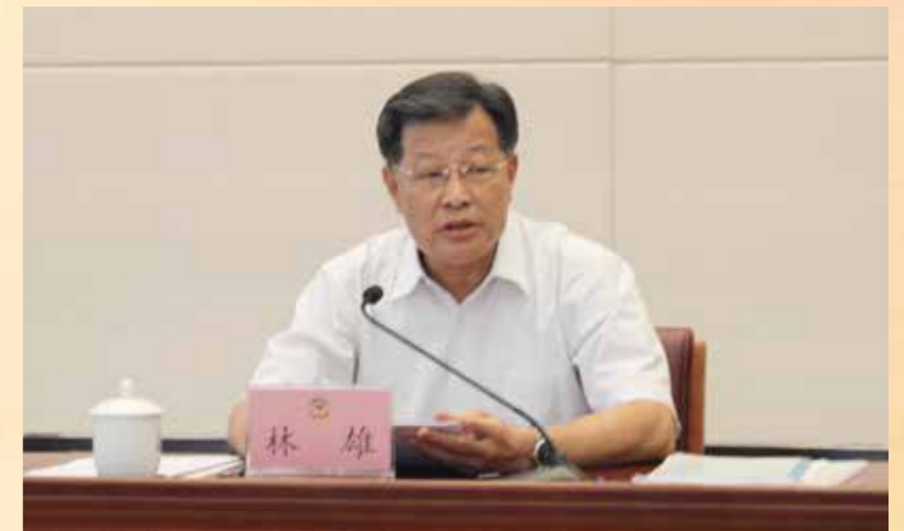
▲ 省政协党组副书记、副主席林雄作第二期开班动员讲话