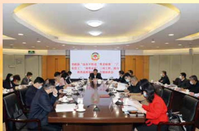
▲ 3月25日，省政协“高水平推进‘粤菜师傅’‘广东技工’‘南粤家政’三项工程，助力我省高质量发展”专题座谈会在省政协机关召开，邓海光副主席主持会议并讲话