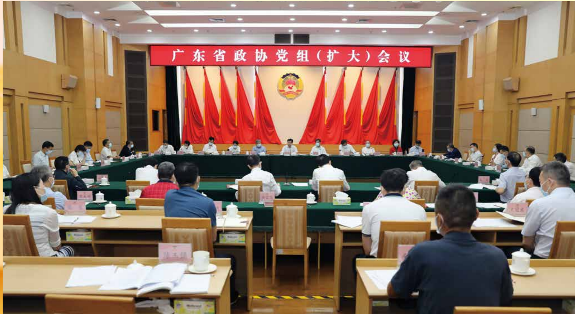
▲ 2022年5月27日上午，省政协党组扩大会议在广州召开，深入学习贯彻习近平总书记近期重要讲话和重要指示精神，传达学习贯彻省第十三次党代会精神，研究部署贯彻落实工作。省政协党组书记、主席王荣主持会议并讲话