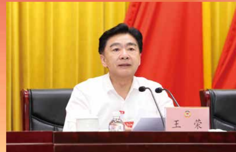
▲ 省政协主席王荣主持会议