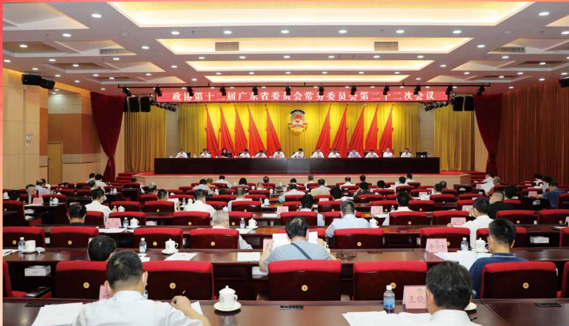
▲ 2022年6月23日至24日，政协第十二届广东省委员会常务委员会第二十二次会议在广州召开。会议围绕“高水平推进‘粤菜师傅’‘广东技工’‘南粤家政’三项工程，助力我省高质量发展”开展专题议政