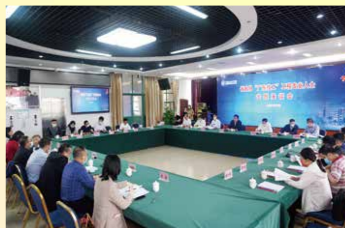
▲ 4月24日、5月16日、6月1日，省政协邓海光副主席率调研组赴广州酒家、广东省机械技师学院、广州为想互联网科技有限公司（51家庭管家）围绕“高水平推进‘粤菜师傅’‘广东技工’‘南粤家政’三项工程，助力我省高质量发展”开展实地调研，并分别主持召开专题座谈会，听取意见建议