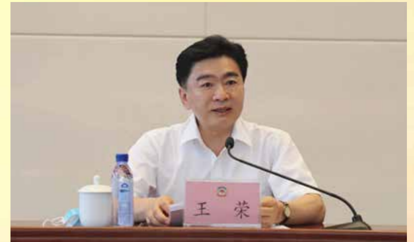
▲ 全省政协系统学习贯彻省第十三次党代会精神研修班分两期举行，省政协党组书记、主席王荣作第一期开班动员讲话