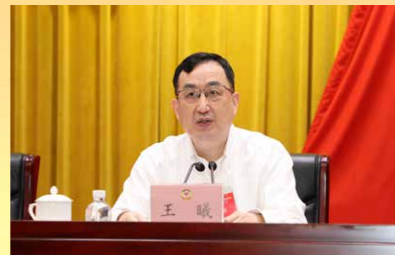
▲ 省委常委、副省长王曦到会通报情况并听取意见建议