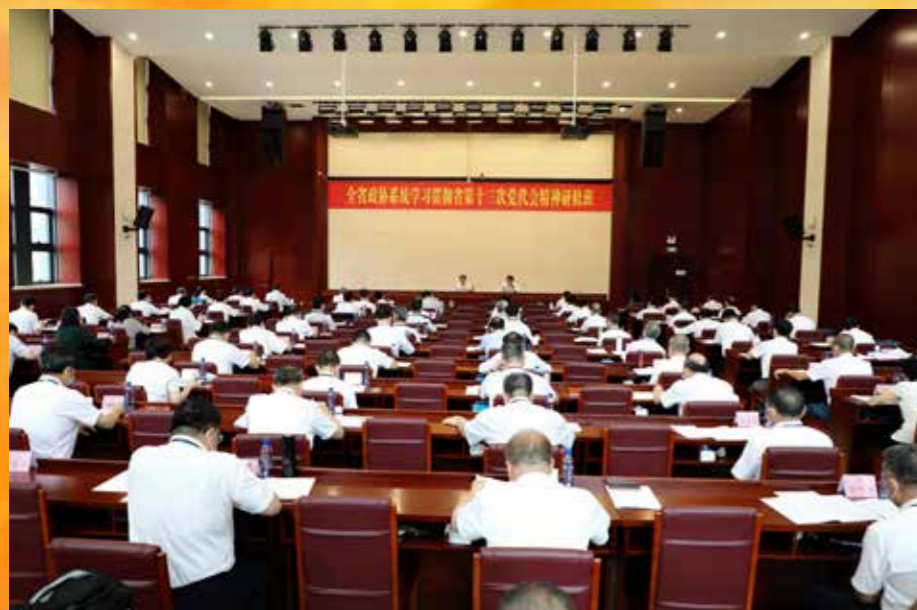
▲ 2022年6月13日至18日，全省政协系统学习贯彻省第十三次党代会精神研修班，分两期在韶关市广东南岭干部学院举行。省政协党组书记、主席王荣作开班动员讲话，来自省委宣讲团、中山大学的专家教授围绕培训主题作辅导报告