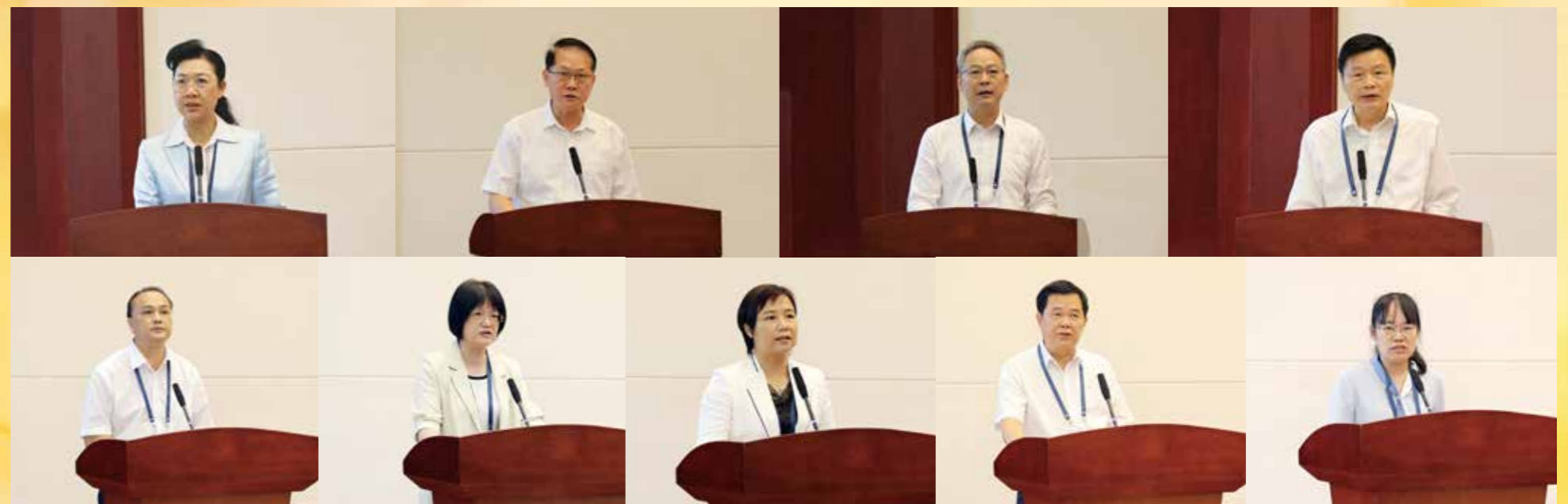
▲ 深圳市政协主席林洁、韶关市政协主席胡海运、阳江市政协主席杨文龙、潮州市政协主席李尧坤、广州市越秀区政协主席谢伟光、珠海市香洲区政协主席陈静、江门市恩平市政协吴永芳、湛江市廉江市政协主席吴永光、肇庆市封开县政协副主席黄梅芬（图片从左往右依次排序）在研修班上登台交流发言