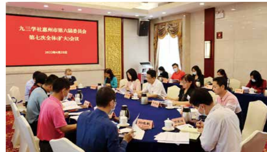
2022年4月23日，九三学社惠州市委员会在惠州宾馆西新楼2号会议室召开六届七次全体（扩大）会议

政党制度是现代民主政治的重要实现形式，是国家政治制度的重要组成部分。一个国家实行什么样的政党制度，是