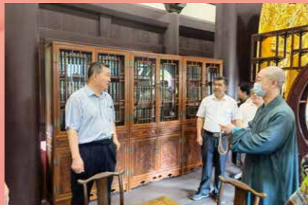
▲ 8月16日至17日，省政协副主席马光瑜率队前往惠州市，就“粤港澳大湾区城市铸牢中华民族共同体意识”开展专题调研，并走访部分宗教活动场所，了解相关工作情况