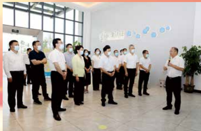
▲ 8月3日至5日，省政协主席王荣先后赴茂名、阳江、云浮，深入产业园区、重大项目和企业一线，就“积极落实‘双碳’战略，促进产业园区高质量发展”开展专题调研