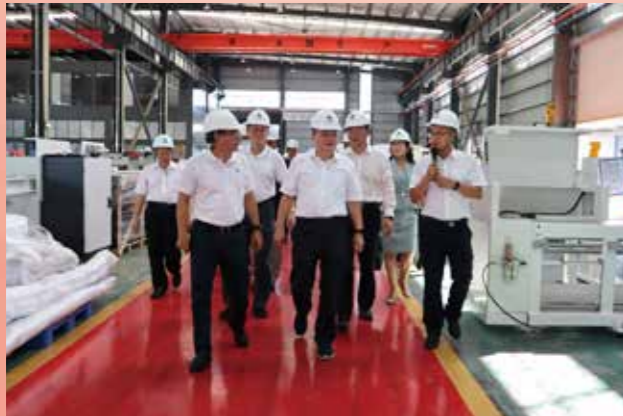
▲ 8月18日至19日，省政协副主席袁宝成率调研组赴韶关市，围绕下半年“粤商·省长面对面协商座谈会”关于“坚定投资信心，推动制造业高质量发展”专题开展调研