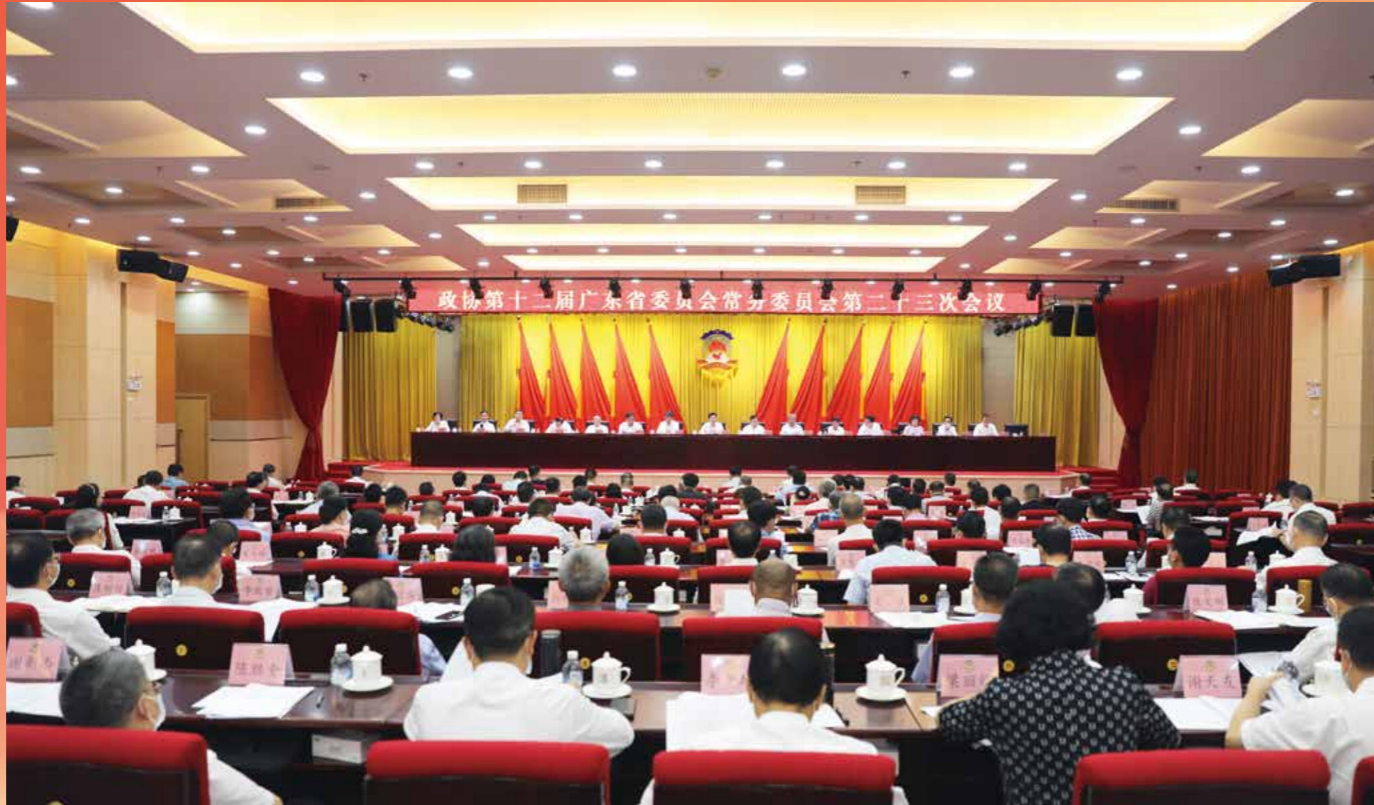
▲ 2022年9月22日至23日，政协第十二届广东省委员会常务委员会第二十三次会议在广州召开。会议围绕“积极落实‘双碳’战略，促进产业园区高质量发展”开展专题议政