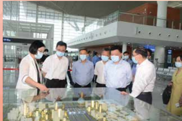
▲ 9月5日，省政协副主席薛晓峰率部分省、市、区政协委员联合调研广州北站综合交通枢纽建设工作