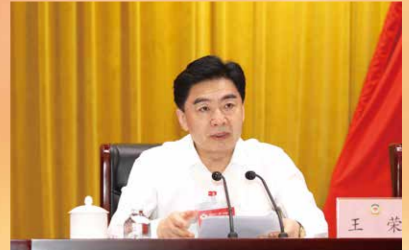
▲ 省政协主席王荣主持会议