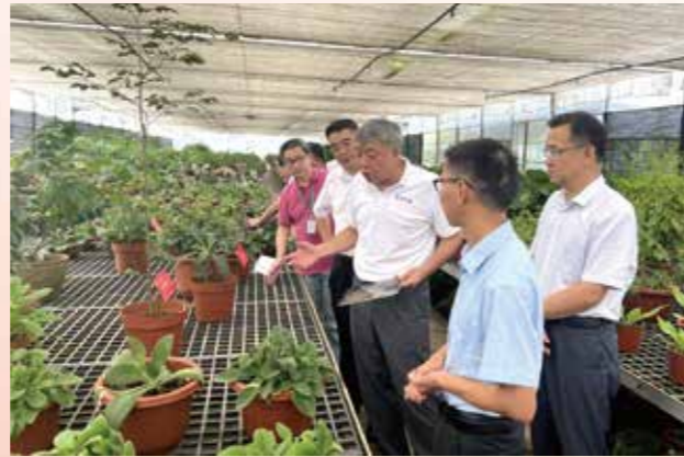
▲ 8月12日，省政协副主席许瑞生率队赴华南国家植物园开展“国家植物园体系建设”考察