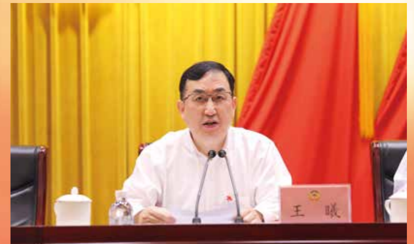
▲ 省委常委、副省长王曦出席会议并通报相关情况