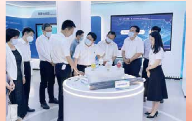
▲ 7月14日至15日，省政协副主席郑振涛率队赴梅州市，围绕“创新科技体制机制，以科技赋权激励和推动科技成果转化”开展专题调研