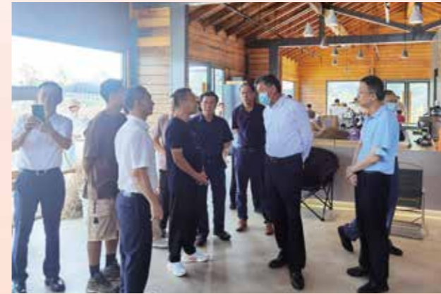
▲ 8月24日至25日，省政协副主席邓海光率调研组到佛山市高明区、三水区开展乡村振兴民主监督调研