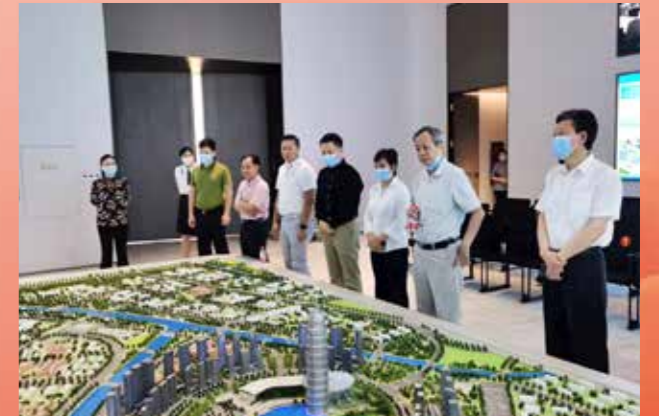
▲ 6月20日至26日，省政协副主席张嘉极率港澳委员考察团，赴陕西、河南省开展“中国历史文化和红色文化”主题学习考察活动