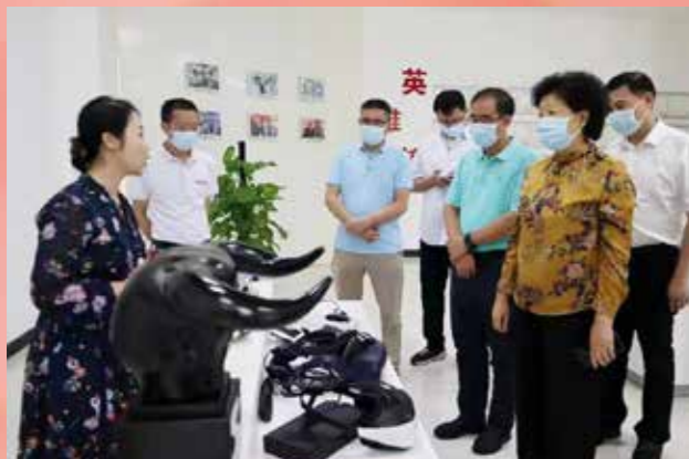
▲ 9月7日至9日，省政协副主席李心率调研组赴中山、珠海，围绕下半年“粤商·省长面对面协商座谈会”关于“坚定投资信心，推动制造业高质量发展”专题开展调研