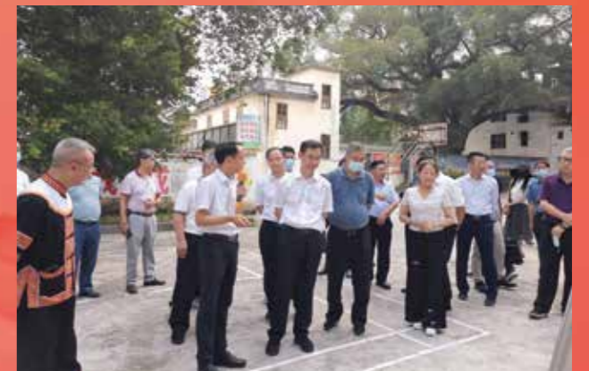
▲ 7月20至21日，省政协副主席温国辉率调研组赴清远市，就2022年省政协主席会议督办重点提案《关于巧用居住权制度解决“空心村”问题，振兴乡村留住乡愁的提案》（第20220271号）开展督办调研