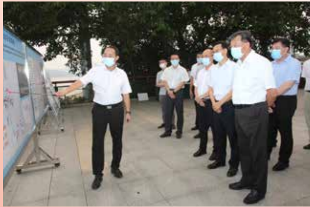
▲ 9月19日至21日，省政协副主席林雄率调研组赴云浮、肇庆、佛山、中山等地，就《关于加快发展我省内河游轮经济的系列提案》，开展省政协主席会议督办重点提案现场调研