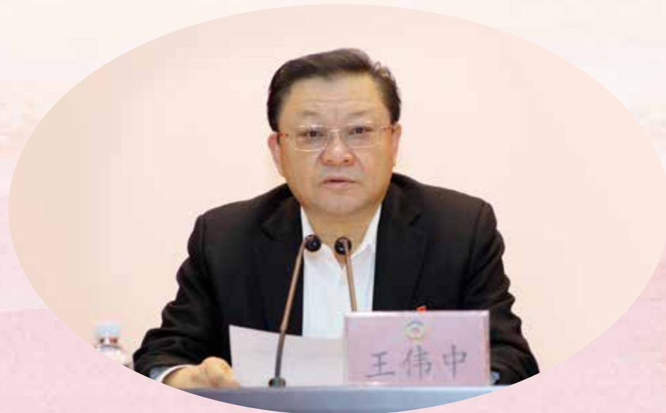
省委副书记、省长王伟中到会作《政府工作报告（征求意见稿）》说明