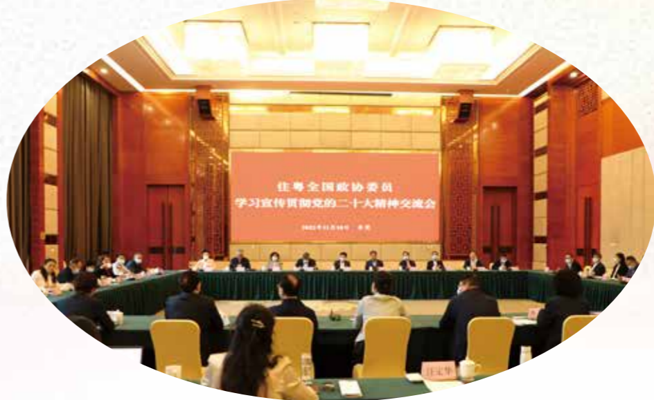
11月10日，住粤全国政协委员学习贯彻党的二十大精神交流会在东莞市召开。党的二十大代表、住粤全国政协委员活动召集人、省政协主席王荣出席并讲话