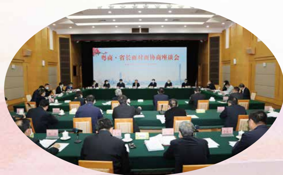
12月5日，粤商·省长面对面协商座谈会在广州召开。围绕“坚定投资信心，推动制造业高质量发展”主题，粤商企业家代表与省政府领导、省直有关部门负责人深入协商交流、共商发展良策、凝聚发展共识。省委副书记、省长王伟中出席并讲话，省政协主席王荣主持