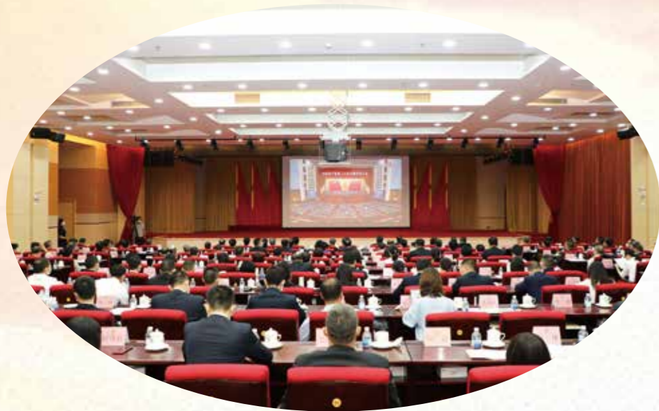
2022年10月16日上午，党的二十大在北京隆重开幕。省政协机关全体干部职工在省民主大楼集中收看开幕盛况，认真聆听习近平总书记代表第十九届中央委员会向大会所作的报告