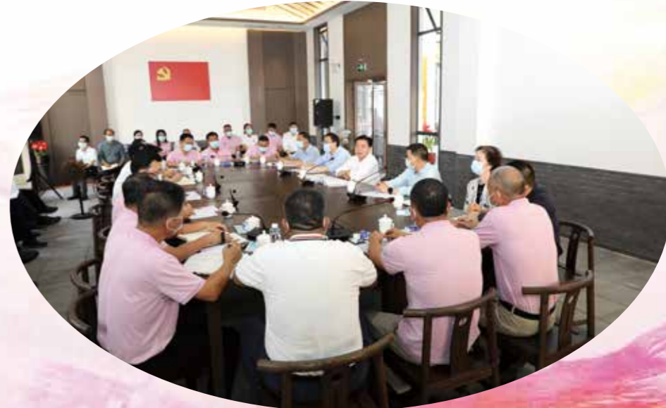
11月17日，党的二十大代表，省政协党组书记、主席王荣深入定点联系的惠州市博罗县，向基层党员干部群众宣讲党的二十大精神，并调研巩固拓展脱贫攻坚成果同乡村振兴有效衔接工作