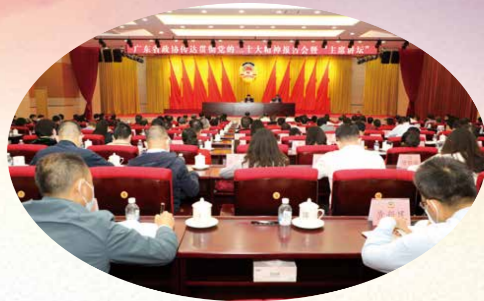
11月2日，省政协传达学习贯彻党的二十大精神报告会暨“主席讲坛”在广州召开。党的二十大代表，省政协党组书记、主席王荣传达党的二十大精神，对全省政协系统学习贯彻工作进行再动员再部署