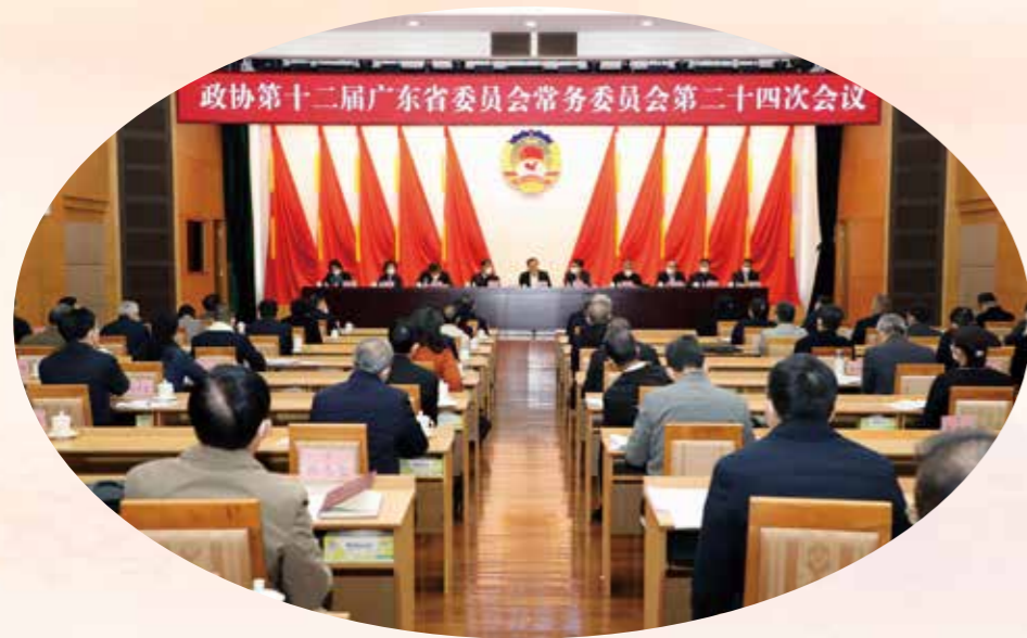
12月20日，政协第十二届广东省委员会常务委员会第二十四次会议在广州召开。会议决定，省政协十三届一次会议于2023年1月在广州召开