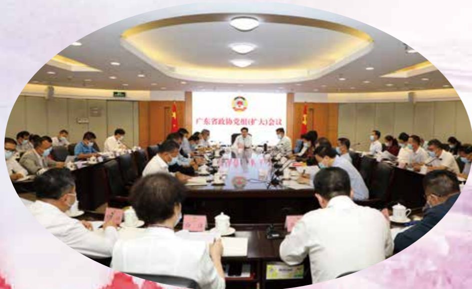
10月31日，省政协党组召开扩大会议，认真学习贯彻党的二十大精神和习近平总书记在中央政治局会议、中央政治局集体学习时的重要讲话精神，传达学习贯彻省委常委会会议、全省领导干部会议和全省传达贯彻党的二十大精神大会精神，研究部署贯彻落实举措。省政协党组书记、主席王荣主持会议并讲话