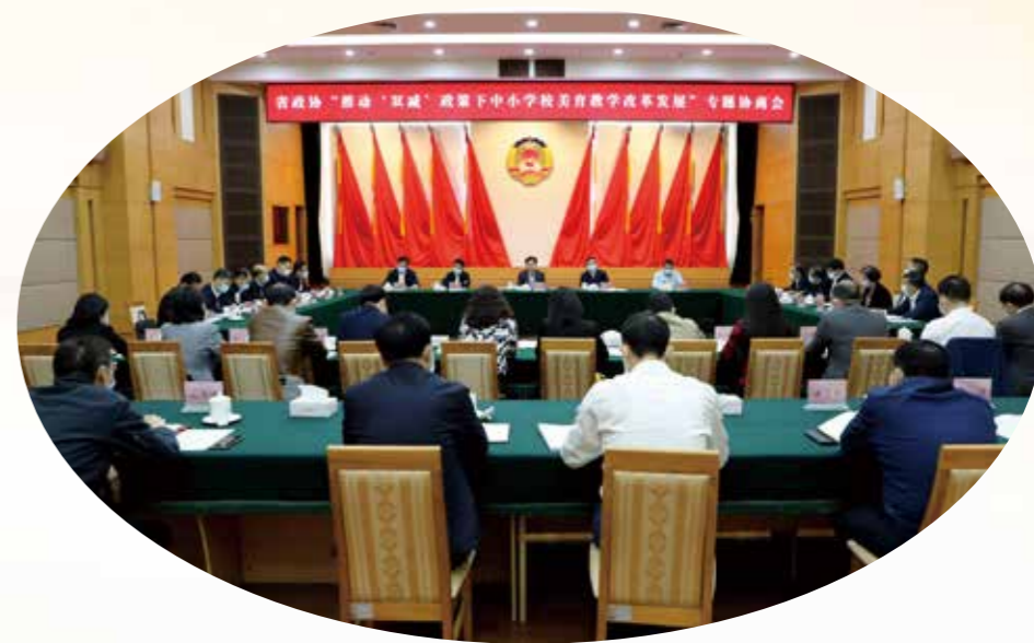
11月8日，省政协召开“推动‘双减’政策下中小学美育教学改革发展”专题协商会。省政协主席王荣主持会议，省委常委、副省长王曦出席