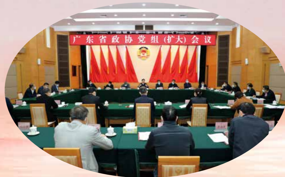
12月9日，省政协党组召开扩大会议，深入传达学习习近平总书记近期重要讲话和重要指示精神，传达学习贯彻省委十三届二次全会精神，研究贯彻落实意见。省政协党组书记、主席王荣主持会议