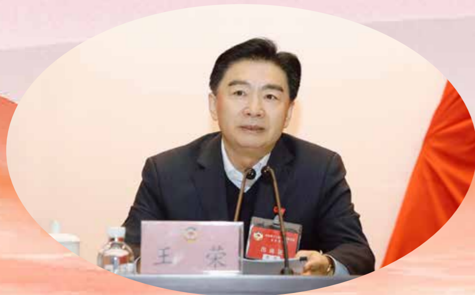
省政协主席王荣出席并讲话