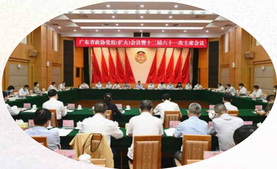
10月25日上午，省政协党组扩大会议暨十二届六十一一次主席会议在广州召开，传达学习贯彻党的二十大精神，研究部署省政协贯彻落实工作。省政协党组书记、主席王荣主持会议