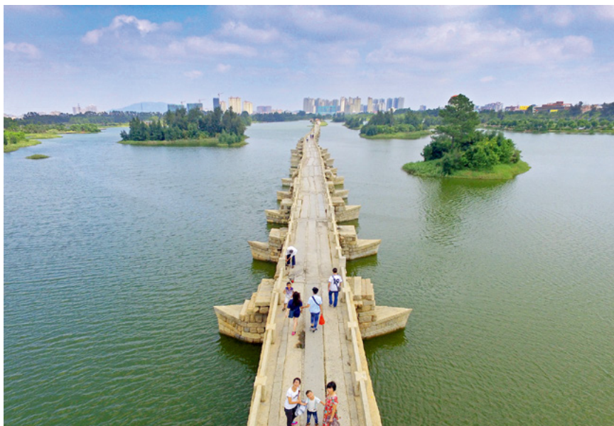
泉州市安平桥，又名五里桥。

泉州古称刺桐城，地处福建东南沿海、台湾海峡西岸，为东海与南海的分界处，湾多水深，建港条件优越。早在唐代，泉州就是我国的四大对外贸易港口之一。随着造船与航海技术的进步，东南沿海的海运业发展迅速。历经晋人南迁等三次中原人口南下大潮，泉州呈现空前的大繁荣景象。宋代朝廷在泉州设立市舶司，统一管理海关与外贸