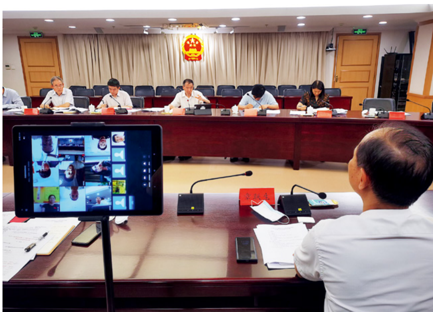
6月下旬，全国人大教科文卫委员会副主任委员吴恒就“修改国境卫生检疫法”“制定中医药传统知识保护法”“修改疫苗管理法”“修改基本医疗卫生与健康促进法”“修改传染病防治法”等5件议案办理工作进行调研时，邀请了近30位联名提出议案的代表，通过信息化平台视频参会。

在银保监会召开金融支持乡村振兴座谈会时，邀请9位不能到场的代表，以视频方式参会。座谈会上，代表在加大乡村振兴金融投入、健全乡村