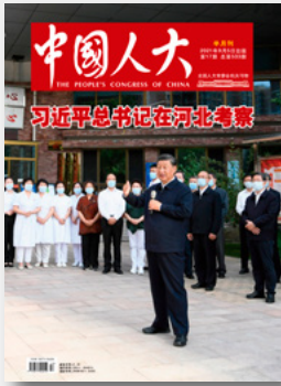
封面图片说明:8月23日至24日,中共中央总书记、国家主席、中央军委主席习近平在河北省承德市考察。这是24日下午,习近平在承德市高新区滨河社区考察时,同社区居民亲切交流。