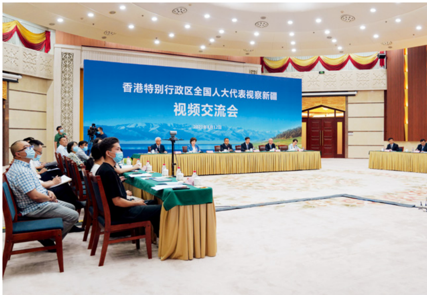
近期，香港全国人大代表视察新疆交流会，以视频连线的方式举行。图为新疆主会场。

新疆维吾尔自治区党委常委、人民政府副主席艾尔肯·吐尼亚孜对香港全国人大代表视察新疆表示热烈欢迎。他介绍，在以习近平同志为核心的党中央坚强领导下，新疆经济社会稳定发展，民族团结和睦友爱，民生事业明显改善，脱贫攻坚取得全面胜利，对外开放不断深化，各族人民群众的获得感、幸福感和安全感持续增强。当前的新疆，处于历史上最好的繁荣发展时期。尽管一些西方国家罔顾事实，谎言污蔑，企图破坏安全稳定大局，但是阻挡不了新疆奋力前进的步伐。希望大家在疫情好转后到新疆实地考察指导，感受新疆人民的热情好客，领略天山南北