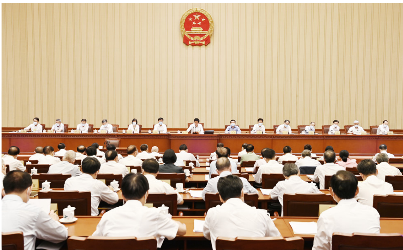
8月20日，十三届全国人大常委会第三十次会议在北京人民大会堂闭幕。栗战书委员长主持会议。