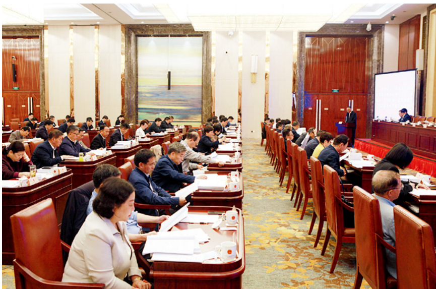
4月25日，苏州市十六届人大常委会第三十三次会议通过《苏州市太湖生态岛条例》，提出将太湖生态岛建设成为低碳、美丽、富裕、文明、和谐的生态示范岛。

苏州市人大及其常委会开展的以太湖生态岛条例为代表的一系列立法工作，充分体现人民意志、保障人民权益、激发人民创造。不仅以高质量立法保障高质量发展、增进民生福祉、推进