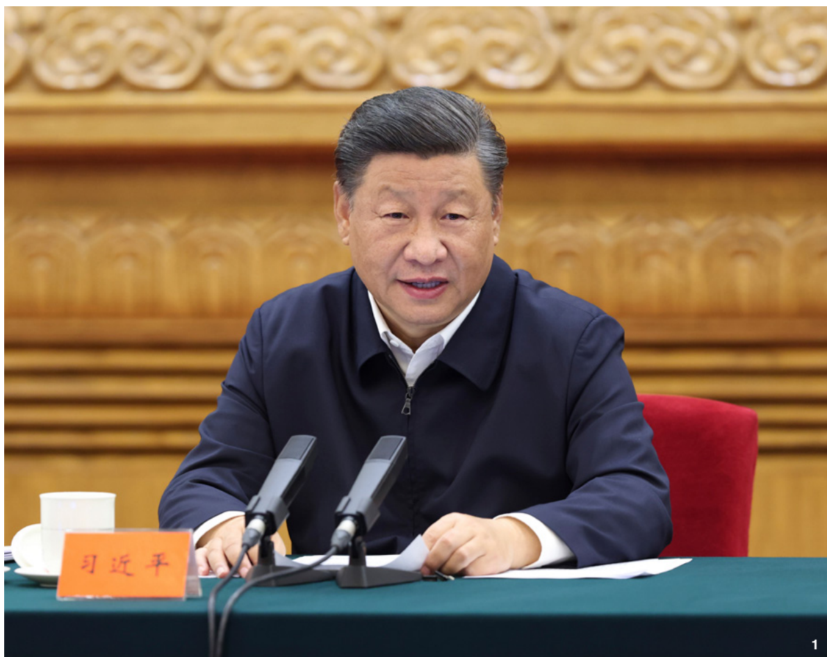
① 8月27日至28日，中央民族工作会议在北京召开。中共中央总书记、国家主席、中央军委主席习近平出席会议并发表重要讲话。