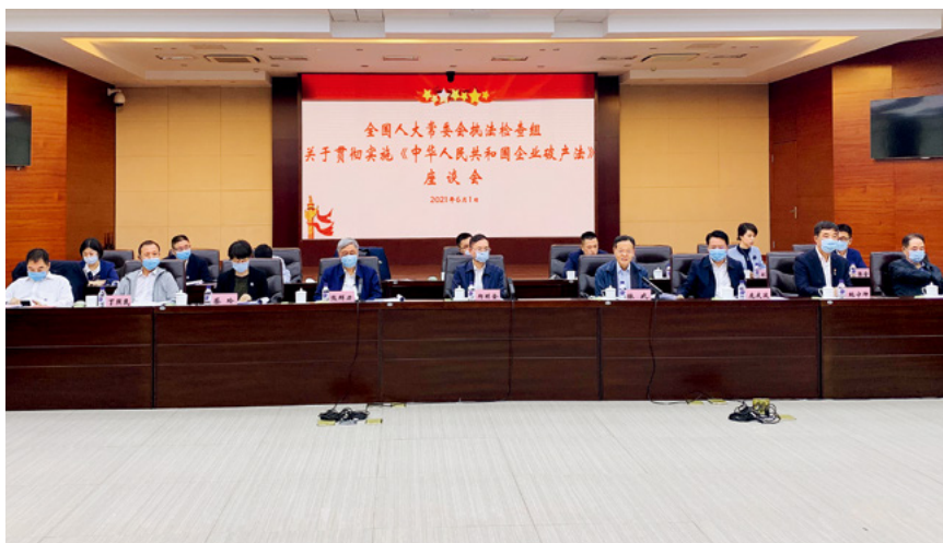
5月31日至6月5日，全国人大常委会副委员长郝明金率（中）全国人大常委会企业破产法执法检查组在吉林省、山西省开展执法检查。图为6月1日下午，执法检查组在吉林省长春市中级人民法院召开座谈会，听取实施企业破产法情况汇报。