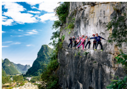
游客在马山县古零镇岩壁上体验飞拉达项目

金秀瑶族自治县以全域旅游示范区创建为契机,以推进贫困村整体脱贫和贫困户持续增收为核心目标,围绕自然生态、瑶族文化、养生健康三大旅游品牌的打造,持续、深入推进旅游扶贫工作。2019年,金秀入选首批国家全域旅游示范区,旅游扶贫成为群众脱贫致富的有力推手。2016—2019年,金秀通过打造文旅品牌,带动4000人以上脱贫致富。