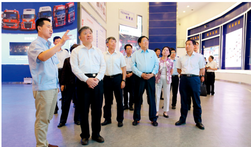
6月23日，全国人大常委会副委员长陈竺（前左二）率全国人大常委会企业破产法执法检查组在陕西汽车控股集团视察。

开展法律宣传，破产法治意识不断增强。各级党委、政府和法院高度重视企业破产法的贯彻实施工作，大力开展