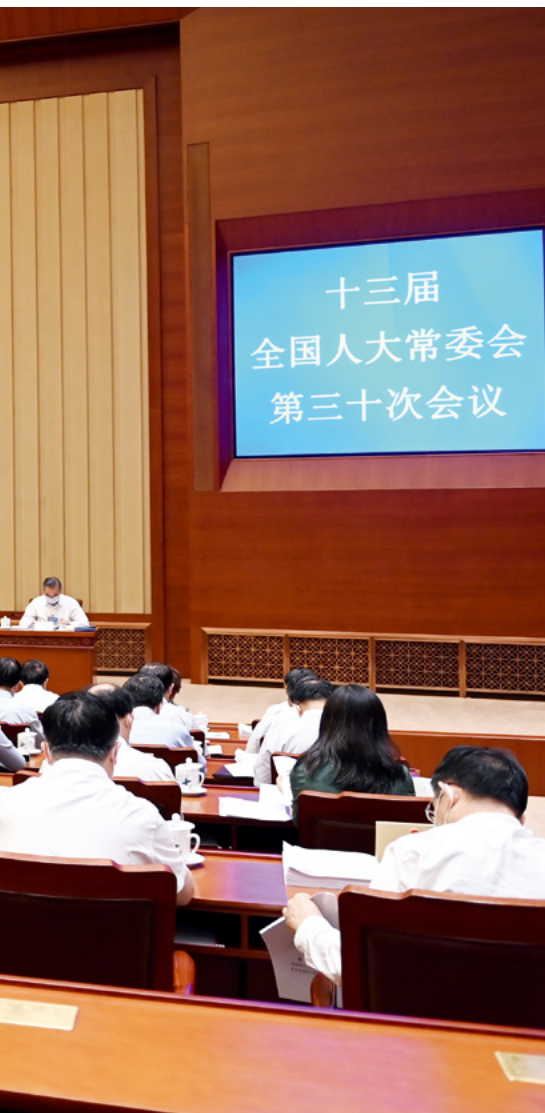
十三届全国人大常委会第三十次会议17日上午在北京人民大会堂举行第一次全体会议。栗战书委员长主持。