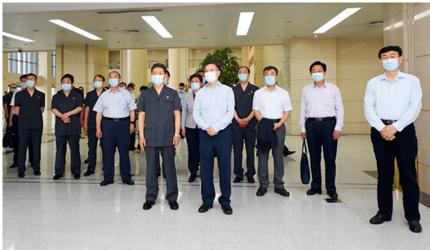
6月3日，全国人大常委会副委员长王东明（前左二）率全国人大常委会企业破产法执法检查组赴山东省高级人民法院检查法律实施情况。