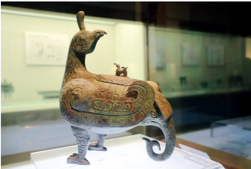
有关部门始终坚持保护第一的原则,文物保护状况明显改善。全国不可移动文物76.67万处,国有可移动文物1.08亿件套。图为山西博物院所藏鸟尊。

中华文明源远流长。从20世纪20年代发掘殷墟,到近年来海昏侯墓、江口沉银遗址等发掘,中国考古学经过不断的发展,为我国历史研究作出了突出贡献。