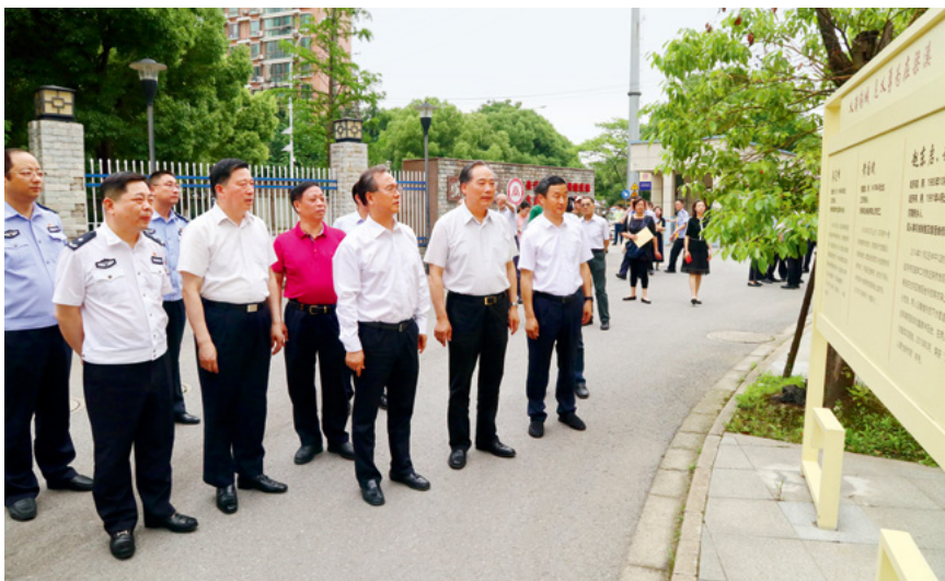
5月28日，无锡市人大常委会对《无锡市奖励和保护见义勇为人员条例》实施情况开展执法检查。