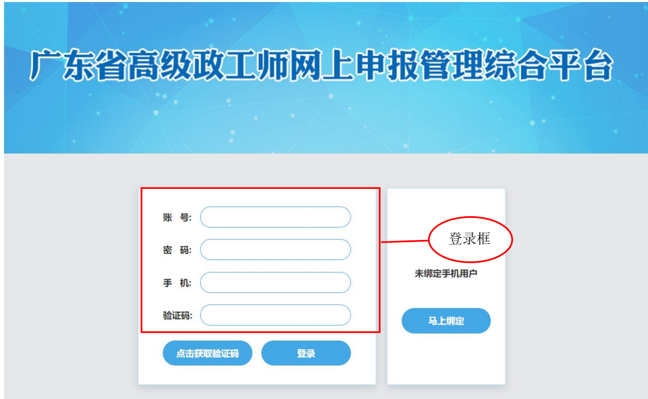
图 4-1-3 登录页面

输入账号、密码、手机号码和验证码可以登录本系统。无本单位账号的请联系上级主管部门（二级账号、一级（系统）账号）新建本单位审核账号。