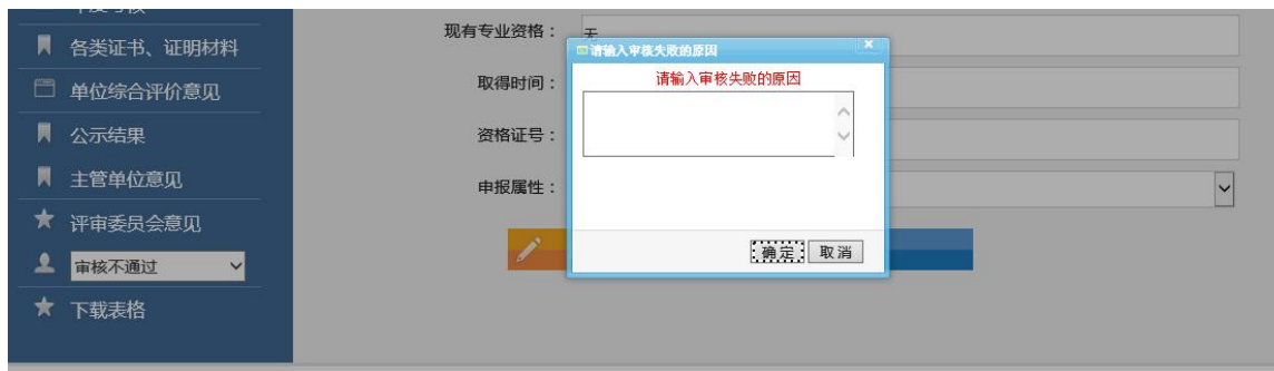
图 4-5-5 审核操作确定按钮