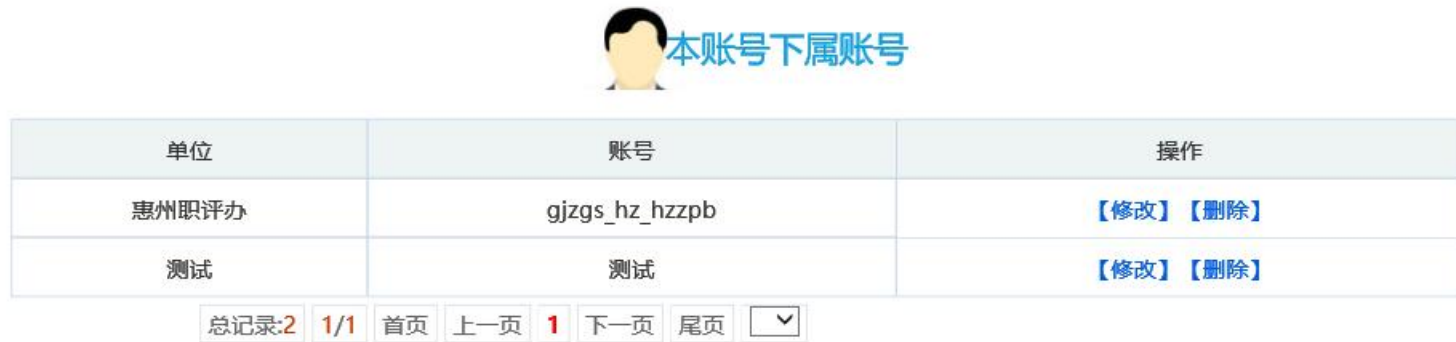
图 4-4-2 下属账号管理页面

2. 下属账号管理。 一级、二级账号具有账号管理功能。可以对本单位下属账号进行修改、密码重置的功能。一级、二级账号登录系统后点击首页“管理员信息管理”按钮（图 4-3-3），进入账户管理页面（图 4-4-2）。