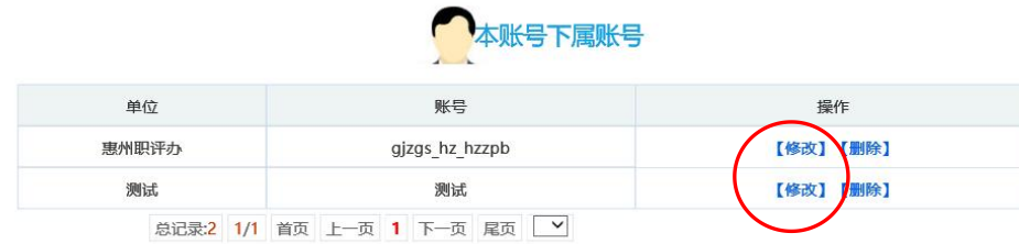
图 4-3-4 下属账号管理页面