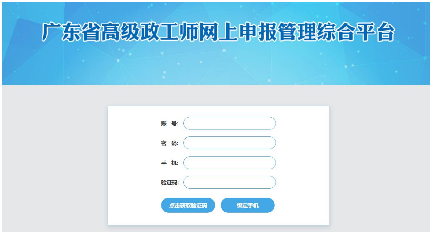
图 4-2-2 绑定页面