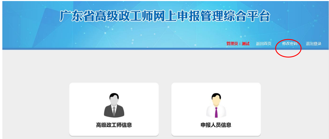
图 4-3-1 修改密码

1.初次登陆修改密码。用户初次登录系统后请尽快修改密码，可以通过登录页面首页的“修改密码”链接进行密码重置。