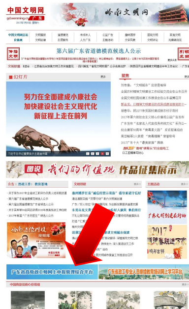
图 4-1-1 广东文明网系统所在位置页面

打开浏览器，输入 http://app.southcn.com/zhenggongshi/new/user/ 进入广东省高级政工师网上申报管理综合平台首页，或通过广东文明网（ http://gd.wenming.cn/ ）首页第三屏横幅点击进入系统。