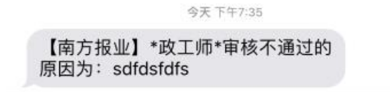
图 4-5-6 审核不通过原因告知短信