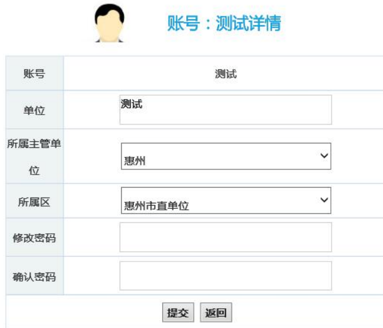
图 4-4-3 账号信息修改页面