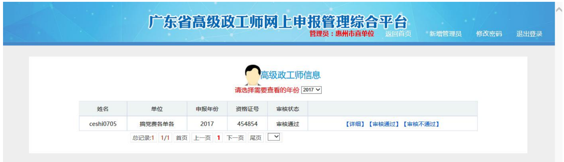
图 4-5-1 申报人员信息页面

如图所示，点击“详细”可查看该申报人员的详细资料（图 4-5-2）。审核人员逐项审查该申报人员的信息，三级审核员主要负责核对申报人员信息的真实性进行审核；二级审核员和一级审核员主要负责对申报人员是否符合高级政工师评审条件进行审核。审核未完成前，审核人员可以对编辑框内的内容进行修改补充。审核完成后，审核人员点击审核框内的内容，选择审核状态（图 4-5-3）。确定审核状态后，在弹出的对话框内点击“是”（图 4-5-4）。如果审核不通过，需在弹出的对话框内（图 4-5-5）输入不通过的原因。