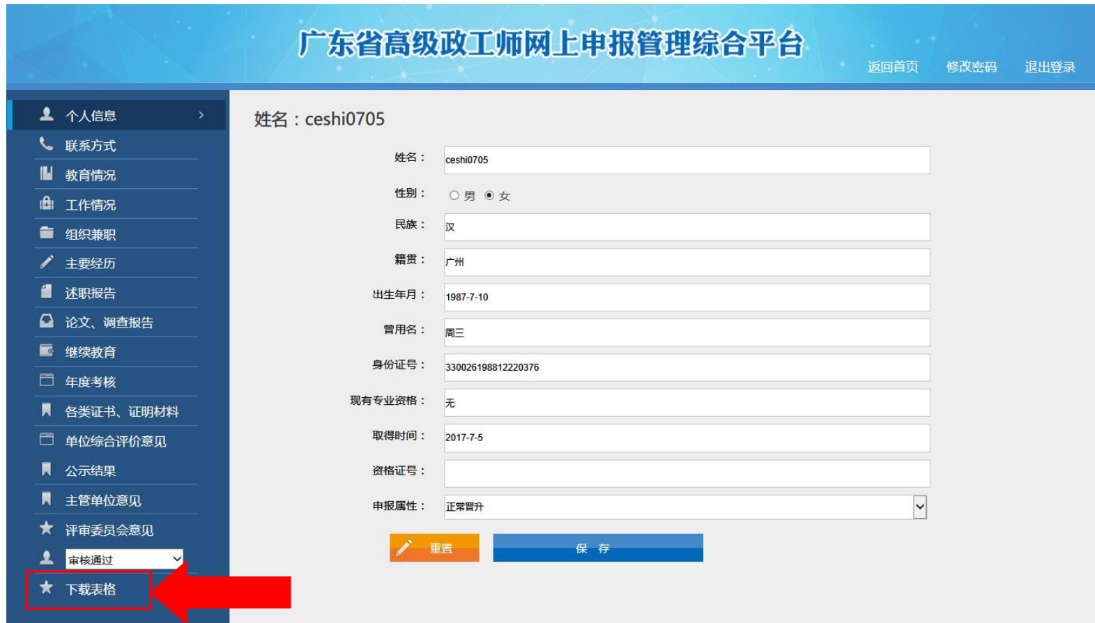
图 4-6-1 申报人详细资料页