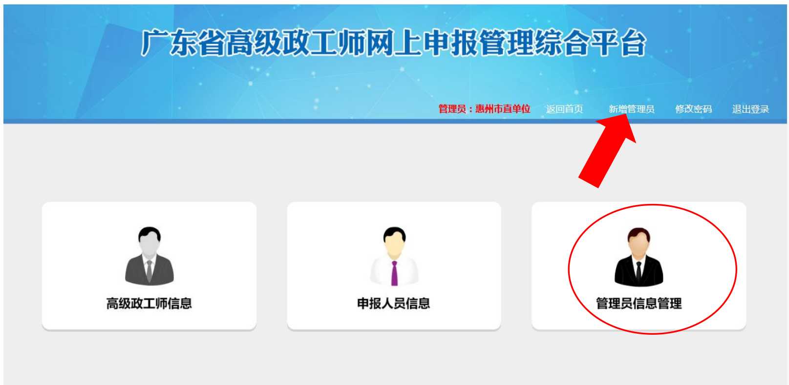
图 4-3-3 一级、二级账户登录页面首页