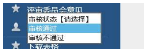
图 4-5-3 申报人员详细信息