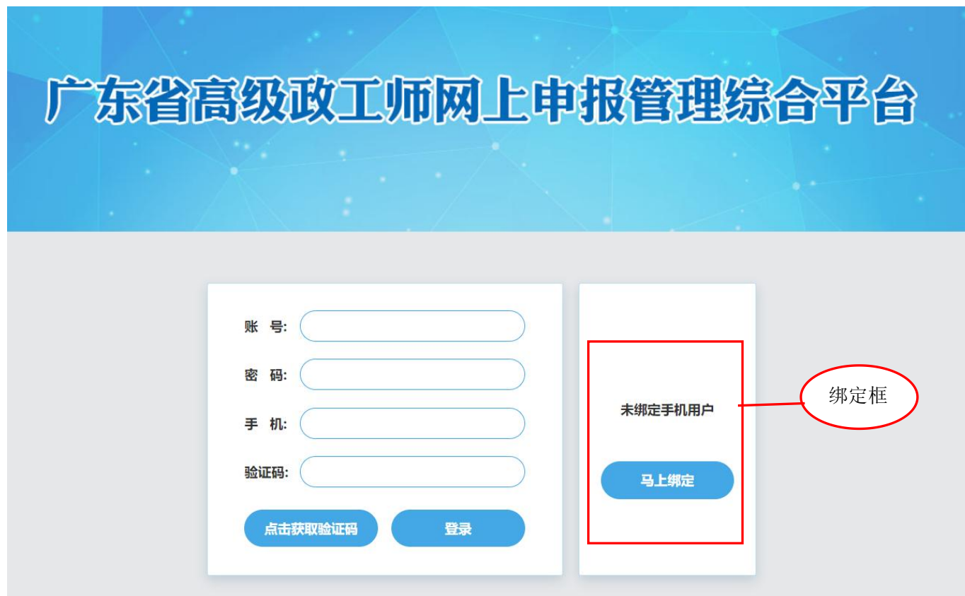
图 4-2-1 登录页面

未绑定手机用户点击页面右方绑定框的蓝色按钮“马上绑定”，进入绑定页面，如图 4-2-2。