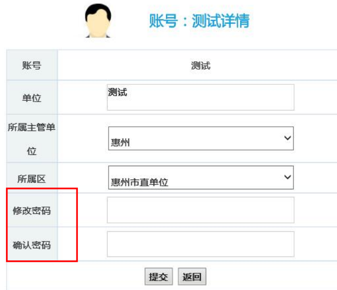
图 4-3-5 下属账号信息修改页面