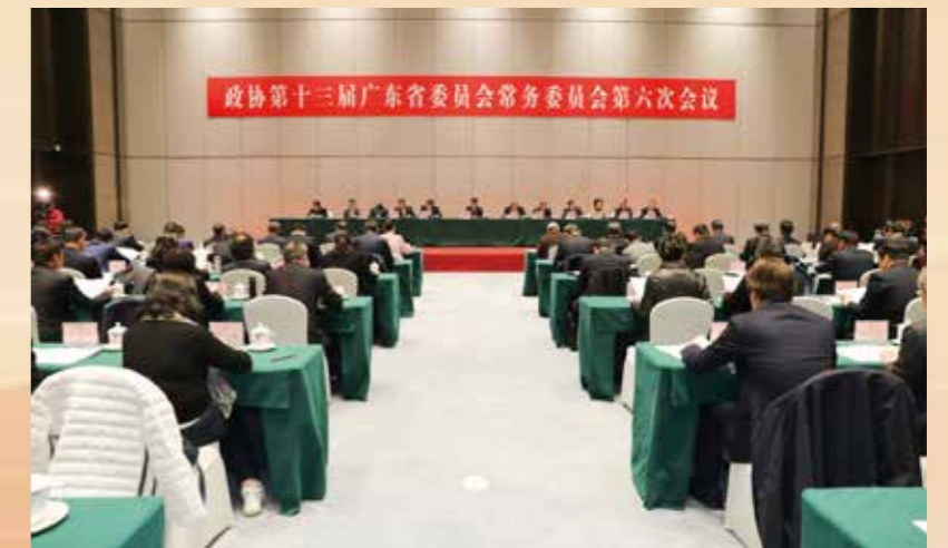
▲ 1月23日上午，省政协主席林克庆主持召开政协第十三届广东省委员会常务委员会第六次会议，审议政协第十三届广东省委员会第二次会议决议（草案）