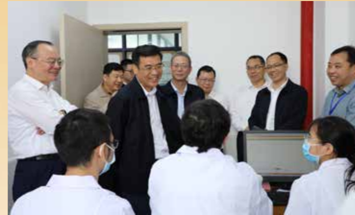
◀ 1月31日至2月1日，根据省领导同志定点联系市县工作安排，省政协主席林克庆率调研组到惠州市，围绕贯彻落实习近平总书记视察广东重要讲话、重要指示精神，落实省委“1310”具体部署，扎实推动“百县千镇万村高质量发展工程”，促进城乡区域协调发展开展专题调研