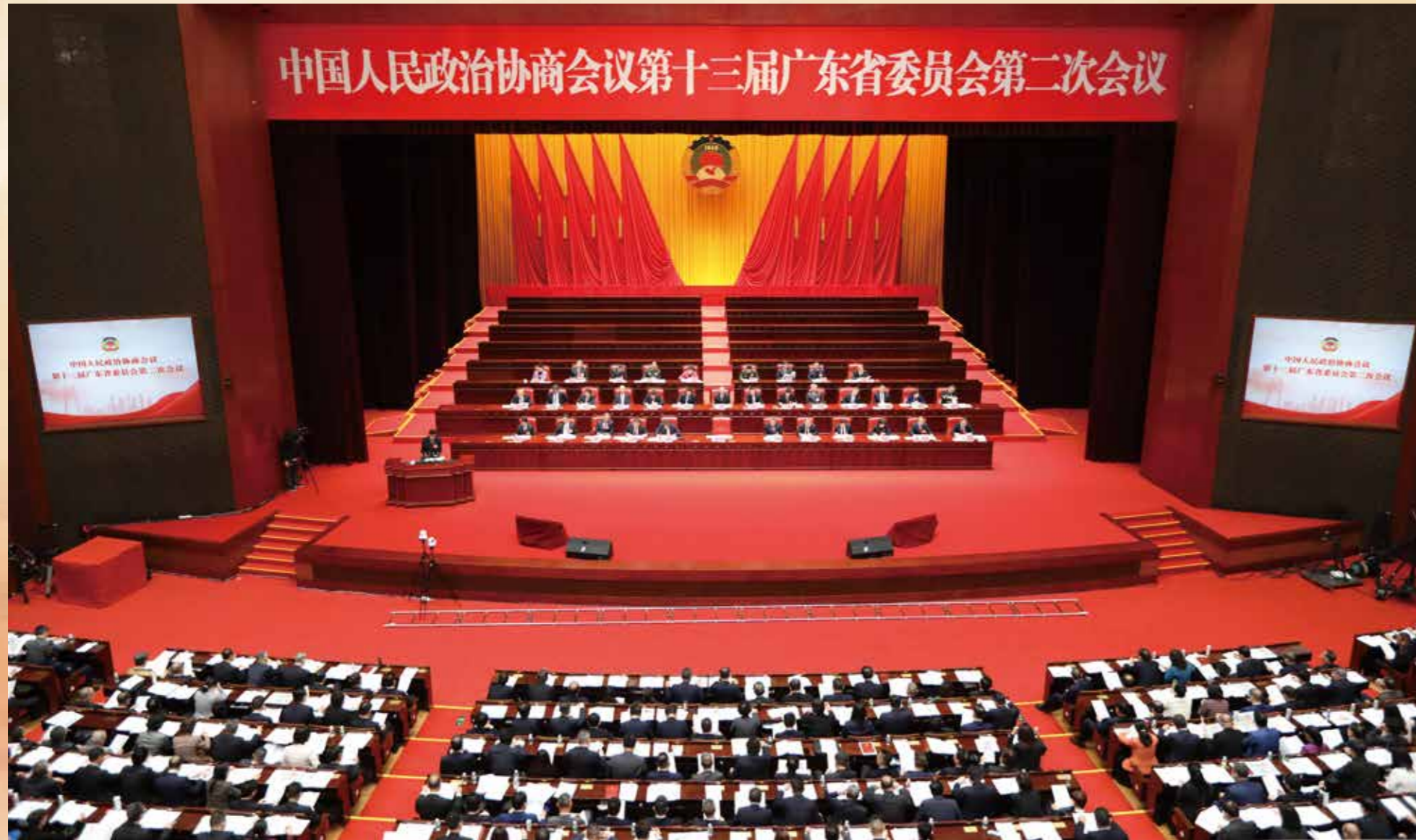
▲ 2024年1月22日上午，中国人民政治协商会议第十三届广东省委员会第二次会议在广州开幕