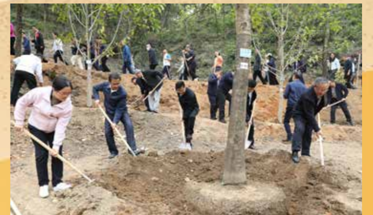
3月21日，省政协组织住粤全国政协委员和省、市、县政协委员在清远市银盏林场开展植树造林活动。省政协主席林克庆出席活动并作动员讲话