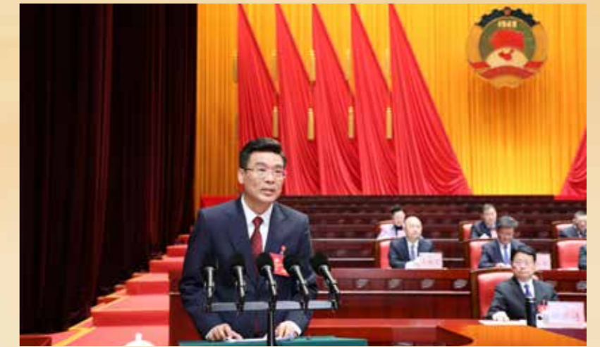
▲ 省政协主席林克庆代表政协第十三届广东省委员会常务委员会向大会报告工作