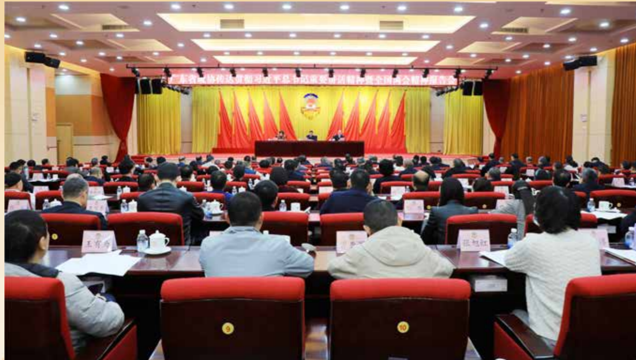
▲ 2024年3月13日，省政协传达贯彻习近平总书记重要讲话精神暨全国两会精神报告会在广州召开。住粤全国政协委员活动召集人，省政协党组书记、主席林克庆主持报告会并讲话。全国政协委员，省委常委、统战部部长，省政协党组副书记王瑞军传达习近平总书记在全国两会上的重要讲话精神，全国政协常委、省政协副主席李心传达全国政协十四届二次会议精神