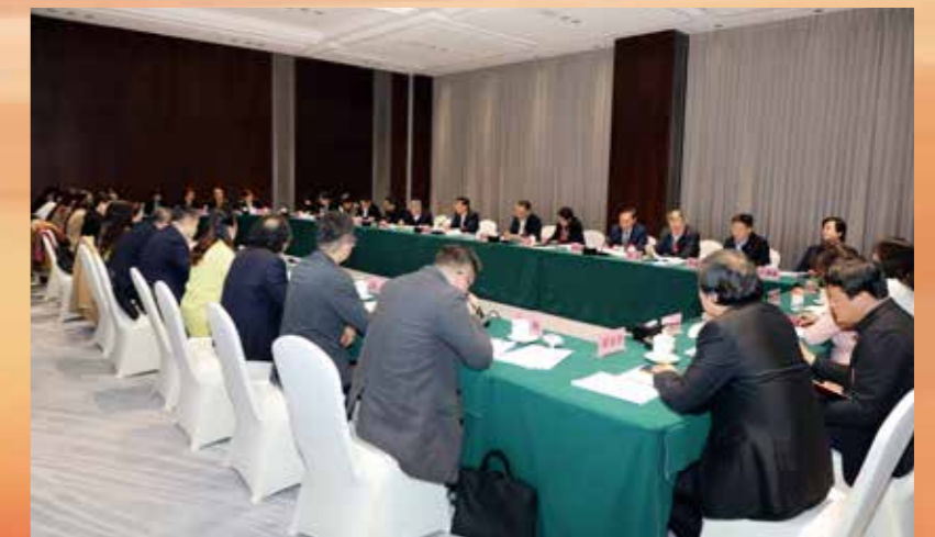
▲ 1月23日，省政协主席林克庆参加省政协十三届二次会议文化艺术界委员分组讨论，围绕加强文化强省建设、提升文化遗产传承保护水平、推进文旅产业融合发展等主题与委员们深入交流，听取意见和建议