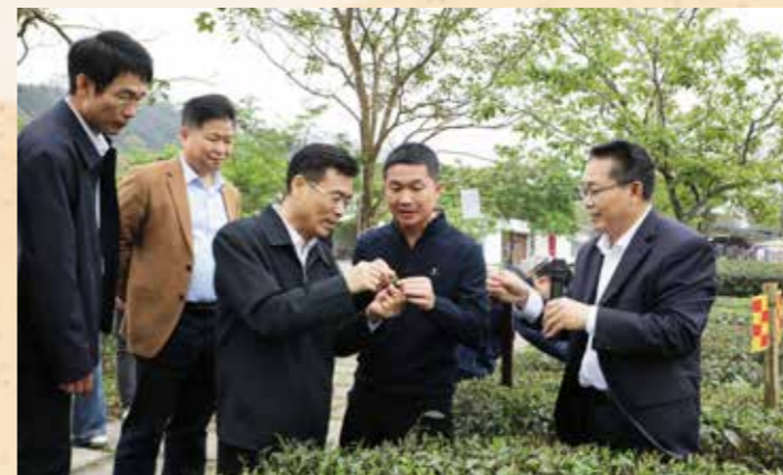
◀ 3月21日，省政协主席林克庆率调研组到清远市，走进乡镇农村、种植基地、乡村民宿旅舍等，围绕贯彻落实习近平总书记在全国两会上的重要讲话和全国两会精神，贯彻落实习近平总书记视察广东重要讲话重要指示精神，聚焦落实省委“1310”具体部署，助力推进“百千万工程”开展专题调研