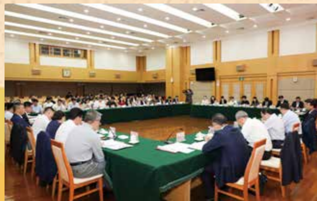
▲ 2月21日下午，省政协召开住粤全国政协委员座谈会，听取我省经济社会发展情况通报，进一步统一思想、凝聚共识，为委员们知情明政、更好在即将召开的全国两会平台上履职尽责作准备。住粤全国政协委员活动召集人、广东省政协主席林克庆主持并讲话。省委常委、副省长王曦到会通报情况