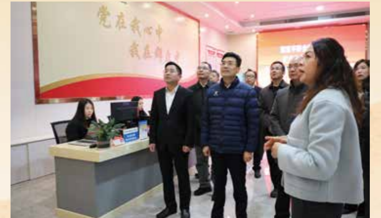
2月26日至27日，省政协主席林克庆率调研组到肇庆市，围绕贯彻落实习近平生态文明思想和习近平总书记视察广东重要讲话、重要指示精神，按照省委“1310”具体部署，聚焦加强生态治理能力建设，扎实推动绿美广东生态建设和“百千万工程”，更好服务广东高质量发展开展专题调研