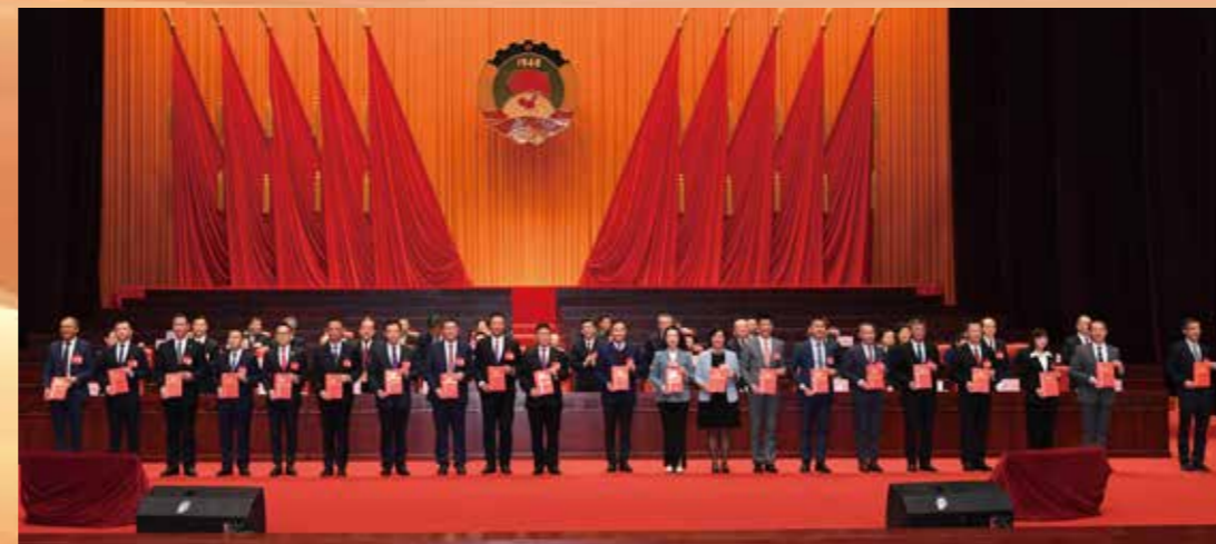
▲ 41件优秀提案及21名履职表现突出的委员受到表彰