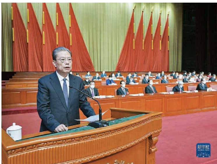
12月15日，中国民主建国会第十二次全国代表大会在北京开幕。中共中央政治局常委赵乐际出席开幕会并代表中共中央致贺词。新华社记者 高洁 摄

贺词指出，新时代新征程为统一战线广大成员施展才能、发挥作用创造了更好机遇、提供了更大舞台。希望民建深入学习贯彻中共二十大精神以及中央统战工作会议精神，认真贯彻习近平总书记关于做好新时代党的统一战线工作的重要思想，团结和引导广大成员坚守合作初心、传承优良传统，深刻领悟“两个确立”的决